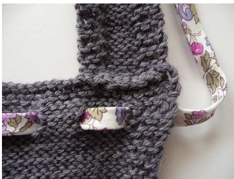
emplacement du relevé de mailles