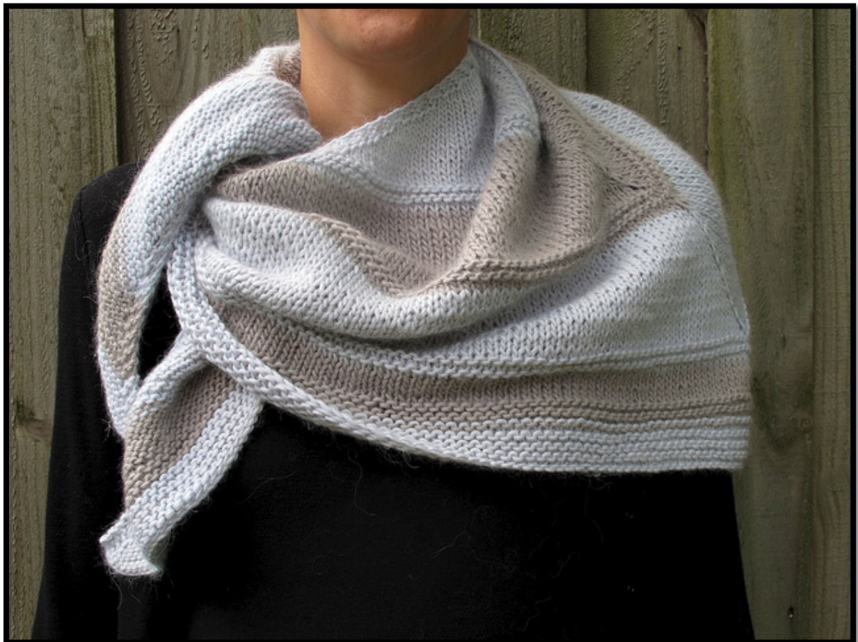
Bicolor version By Kate Dickson

Bloquer si nécessaire pour que le châle prenne la forme d'un triangle parfait